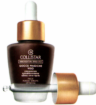
Voor de quick fix, want: binnen een paar uur resultaat. Face Magic Drops, 30 ml, € 31,25 Collistar