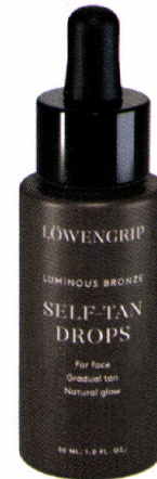
Een paar drupjes mengen met je dagcrème, dan bouw je geleidelijk een tintje op. Luminous Bronze Self-Tan Drops, 30 ml, € 42,95 Löwengrip via Zalando