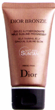
Geeft niet alleen een tintje, maar vooral ook een mooie glow. Dior Bronze Self-Tanning Jelly, 50 ml, € 39,50 Dior