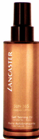
Dagelijks aanbrengen als een bodylotion, voor een kleur die dag na dag iets intenser wordt. Sun 365 Gradual Self Tanning Oil, 150 ml, € 34 Lancaster