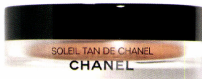
Gebruik 'm voor of na je gewone foundation; een gelcrème voor een gebruint tintje en een matte finish. Soleil Tan de Chanel, € 41 Chanel