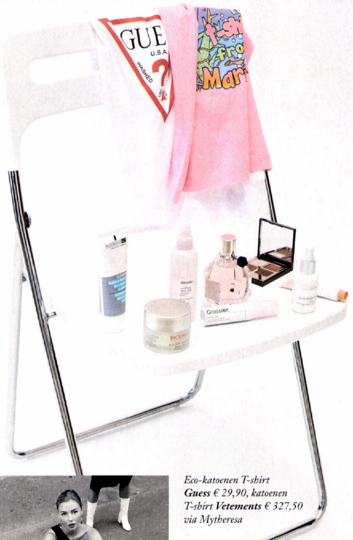
Eco-katoenen T-shirt Guess € 29,90, katoenen T-shirt Vetements € 327,50 via Mytheresa

V.l.n.r. Cleansing Radiance Boost Gel, € 31,50 Biodroga MD , Golden Caviar Radiance & Anti-Age Sleeping Cream-Serum, € 76 Biodroga MD , Soothing Face Mist, € 17 Glossier , Oog- en lipplumping crème Bubblewrap, € 27 Glossier , Eau de Parfum 100 ml Flowerbomb, € 130 Viktor & Rolf , Skin Booster Leave-On Anti-Age Acid Serum, € 75 Biodroga MD , Oogschaduwpalet The Bella Sofia, € 50 Charlotte Tilbury , Lippenbalsem Balm Dotcom in Coconut, € 12 Glossier